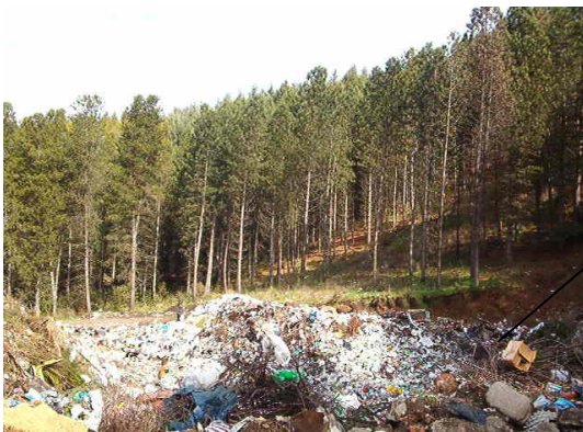
Quema de desperdicios